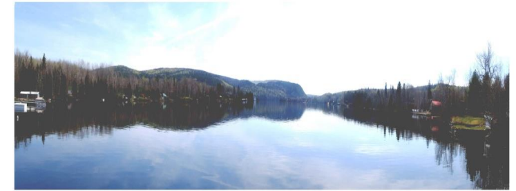
ASSOCIATION DES PROPRIÉTAIRES RIVERAINS DU LAC-À-BEAUCE