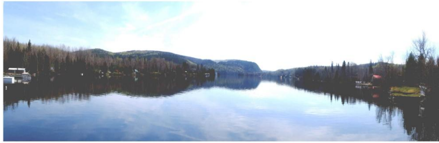
ASSOCIATION DES PROPRIÉTAIRES RIVERAINS DU LAC-À-BEAUCE